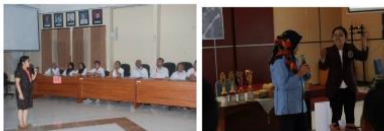
Gambar 3. Tahap 2 (Komunikasi) dari Program Pengabdian Kepada Masyarakat