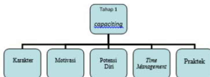
Gambar 2. Diagram Tahap 1 dari Program Pengabdian Kepada Masyarakat

Program pelatihan tahap 1 dibagi kedalam lima fase yang akan dilalui oleh peserta pelatihan. Hal ini dikarenakan untuk menciptakan entrepreneur enabler membutuhkan peningkatan kompetensi karyawan dari aspek internal ( Up-Grade potensi diri), soft skill dan komunikasi dari karyawan. Tahapan up-grade potensi ini merupakan tahapan dasar dari program ini yang menjadi pondasi penting entrepreneur enabler . Berikut ini adalah gambaran program pengabdian masyarakat tahapan 1.