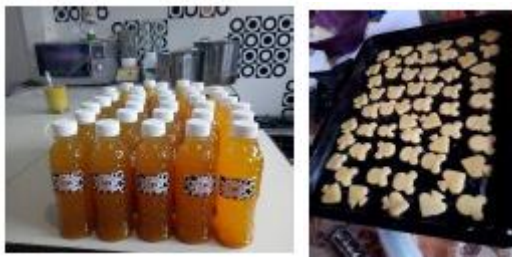
Gambar 5. Produk Karya Entrepreneur Enabler