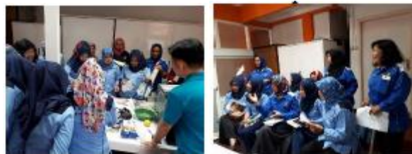
Gambar 4. Tahap 4 ( Entrepreneur Enabler ) dari Program Pengabdian Kepada Masyarakat

pijat, jasa otomotive , bisnis snack , retail (warung). Pendapatan yang diperoleh dari bisnis entrepreneur enabler berkisar diantara Rp. 500.000 – Rp. 3.000.000 setiap bulannya. Tahapan ini merupakan tahapan yang paling sulit karena dari 300 karyawan hanya 10% yang berhasil menciptakan usaha dan menghasilkan pendapatan dengan umur bisnis lebih dari enam bulan. Karyawan yang mengikuti pelatihan tahap 4 totalnya berjumlah 300 orang namun 50% hanya mampu sampai tahap menyusun business plan namun gagal pada tahap eksekusi bisnis. 40% karyawan lainnya mampu menciptakan bisnis namun tidak berhasil mempertahankan usaha operasional minimal 6 bulan hal ini dikarenakan: Keliru menetapkan HPP, analisis resiko yang kurang maksimal, kualitas produk yang dihasilkan belum terstandarisasi, kesalahan dalam memilih media marketing, SOP, dan masalah terkait legalitas. Proses bisnis yang dijalankan entrepreneur enabler menjadi pengalaman sekaligus pedoman untuk mengembangkan bisnis meliputi aspek: aspek karakteristik, indentifikasi peluang kreativitas dan inovasi (Yeoh, K. K., 2017). Antusiasme peserta pelatihan untuk menjadi Entrepreneur Enabler terlihat pada dokumentasi ini.