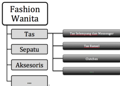
Gambar 1. Struktur Kategorisasi Produk Fashion Wanita pada situs X.

Pengkategorian produk pada situs X dilakukan hingga tiga level. Sebagai contoh, produk tas wanita berada di level kedua dengan “Fashion Wanita” sebagai parent dan beragam jenis tas wanita sebagai children -nya, seperti pada Gambar 1. Setiap produk pada situs X memiliki halaman detail informasi produk. URL halaman detail informasi produk merupakan halaman berekstensi HTML dengan awalan domain situs X. Domain tersebut diikuti beberapa istilah kunci dari produk. Istilah-istilah tersebut dipisahkan dengan tanda garis “-”. Tabel 1 merupakan contoh dari URL halaman detail informasi produk dengan domain asli situs diganti www.x.co.id