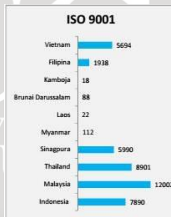
Tabel 1.1 Jumlah Organisasi atau Perusahaan yang tersertifikasi ISO 9001 di ASEAN.