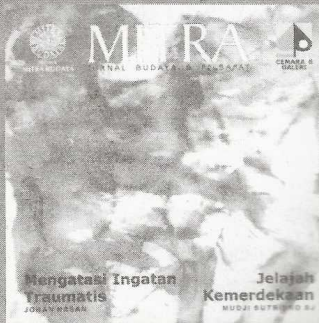
Cover: Agus Djatnika