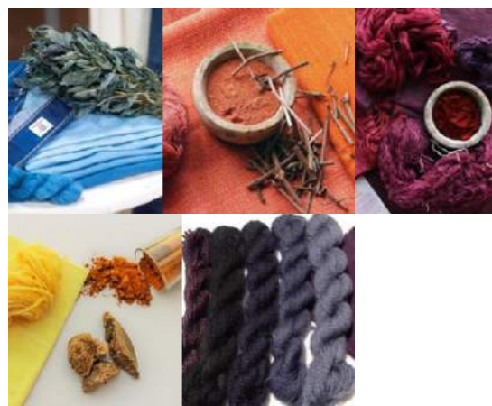
Gambar 5. Pewarna Alam

Menurut KeyColour (2016), beberapa warna alami yang sudah dipakai sejak zaman kuno adalah Indigo (biru), Alizarin (merah), Tyrian Purple (ungu), Yellow (kuning), dan Logwood (abu-abu atau hitam).