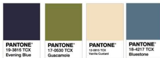
Gambar 8. Tren Warna Resort Wear 2020

Tren warna untuk koleksi resort wear brand Von diambil dari Pantone Color Institute , yang diantaranya adalah Evening Blue (biru tua), Guacamole (olive green), Bluestone (muted blue) dan Vanilla Custard (putih tulang).