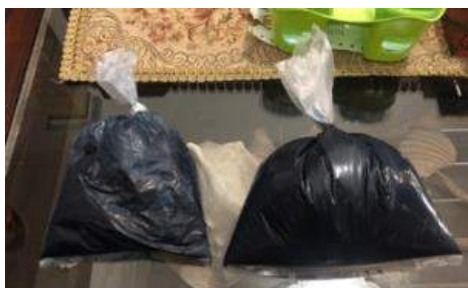
Gambar 1. Pasta Indigofera tinctoria (kiri) dan Strobilanthes cusia (kanan)