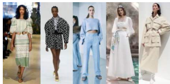
Gambar 7. Tren Fesyen Resort Wear 2020

Style yang menjadi tren untuk resort wear tahun 2020 adalah puff sleeves , prints (motif), relaxed silhouette , dan safari.