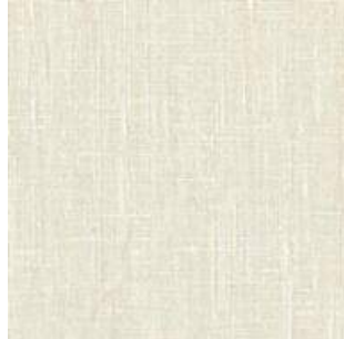
Gambar 9. Tren Material Resort Wear 2020: Kain Linen