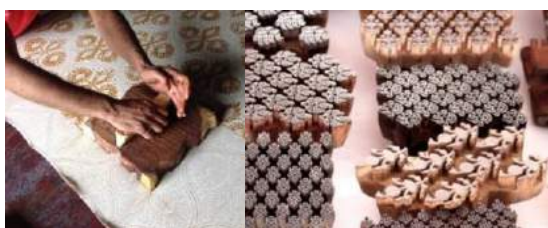
Gambar 6. Block Printing di India

berkembangnya zaman, sehingga dapat dikenal secara global sampai saat ini. Menurut buku Block Prints from India for Textiles oleh Albert Buell Lewis (1924), meskipun desain untuk block print dapat berbeda dari satu tempat ke tempat lain karena banyaknya perkembangan, metodenya tetap kurang lebih sama.