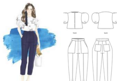
Gambar 15. Look 4 - Capri

Look keempat bernama Capri yang terdiri dari blus dengan puff sleeve lengan pendek model crop dan celana midi . Capri adalah sebuah pulau yang berada di Teluk Napoli, Italia. Bentuk motif Capri merepresentasikan desain motif ubin yang digunakan di dalam kafe-kafe dan resor oleh arsitek di Italia, seperti Gio Ponti dan Carlo Scarpa.