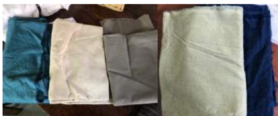
Gambar 2. Eksperimen Pewarnaan terhadap Kain Katun Poplin dan Twill (kiri) dan Kain Katun Linen (kanan)