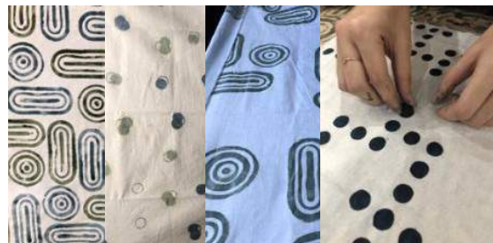
Gambar 3. Eksperimen Pembuatan Motif