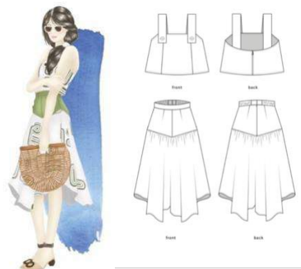
Gambar 16. Look 5 - Clover

Look kelima bernama Clover yang terdiri dari satu set tank top dan rok bermodel handkerchief . Clover adalah tanaman yang biasa diasosiasikan dengan Irlandia. Tiga daun pada tanaman Clover (semanggi) dikatakan menjadi lambang dari keyakinan ( faith ), harapan ( hope ), dan cinta ( love ). Warna hijau yang dipilih dan penempatan motifnya merepresentasikan luasnya padang-padang rumput yang hijau di Irlandia, dan pemandangan indah yang disediakan.