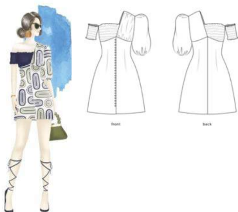
Gambar 14. Look 3 - Cyprus

Look ketiga bernama Cyprus yang terdiri dari sebuah dress pendek. Cyprus adalah nama dari sebuah negara kepulauan di Mediterania Timur. Bentuk-bentuk motifnya merepresentasikan keindahan archway yang ada di bangunan resor Mediterania. Pemilihan warna motif biru dan hijau merepresentasikan garis laut yang bertemu dengan garis pulau di pesisir pantai.