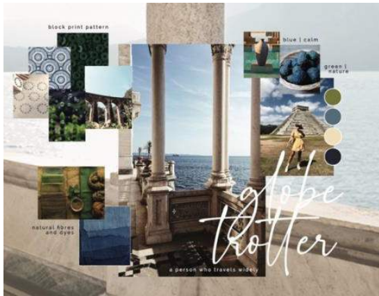
Gambar 11. Mood Board