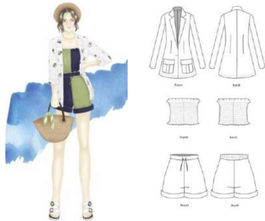
Gambar 12. Look 1 - Calypso

Bentuk motif pada look ini yang terlihat seperti gelembung udara merepresentasikan keringanan yang dirasakan saat berlibur ke Yunani, di mana ada langit yang biru, hijau, udara yang berangin yang gembira.