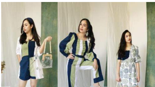
Gambar 17. Koleksi Resort 2020 – Globe Trotter