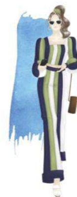
Gambar 13. Look 2 - Caribbean

Look kedua bernama Caribbean yang terdiri dari satu set blus dengan puff sleeve dan celana panjang. Caribbean adalah wilayah dari Benua Amerika yang terdiri dari Laut Karibia, pulau-pulau dan pesisir disekitarnya. Penempatan warna-warna dalam look ini merepresentasikan gradasi warna Laut Karibia pada kedalaman yang berbeda-beda jika dilihat dari atas.