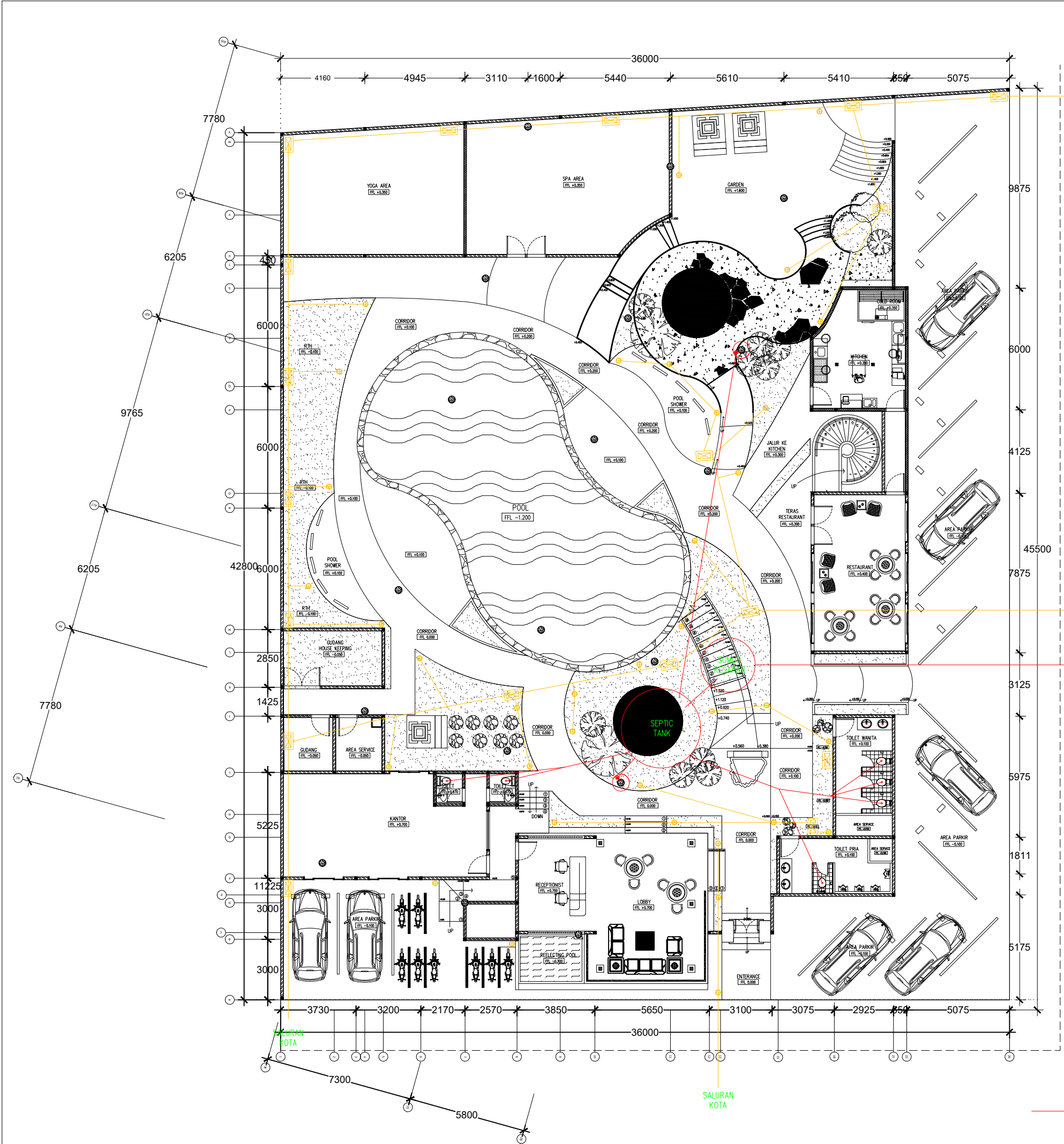
PLUMBING LT 1 TINJA DAN AIR HUJAN SCALE 1 : 200