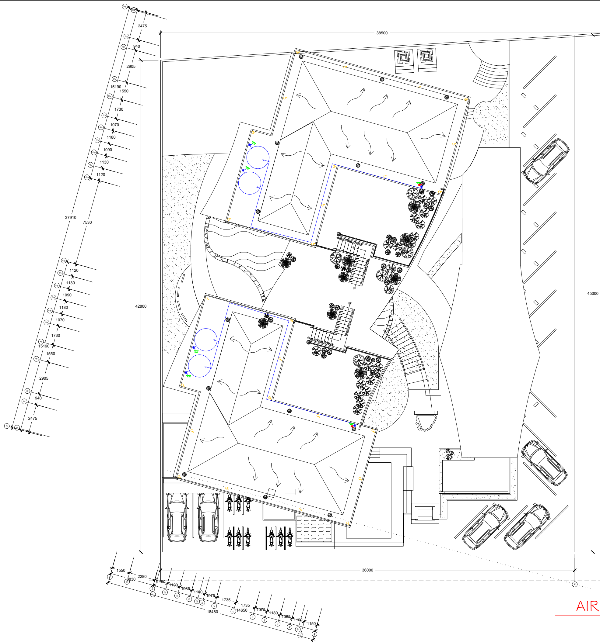
PLUMBING ATAP AIR HUJAN DAN AIR BERSIH SCALE 1 : 200