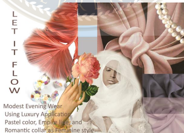
Gambar 3.2.1 : Mood Board