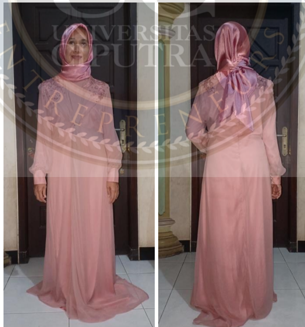
Gambar 3.4.1 : Prototype