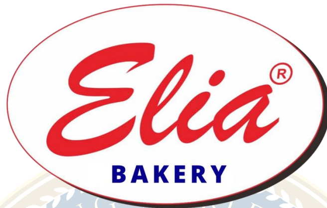
Gambar 1. 1 Logo Elia Bakery

Seiring dengan berjalannya waktu, pada tahun 2002, jumlah armada mobil Elia Bakery mencapai 20 unit. Penambahan armada mobil ini dilakukan untuk mempermudah daya jangkauan konsumen, yang ingin membeli roti. Mobil Elia Bakery ini juga digunakan sebagai salah satu pemasaran karena adanya logo Elia Bakery yang terpampang di mobil kue ini. Tidak lama kemudian, di tahun 2003 buka toko baru di Jalan Majapahit, Semarang. Selanjutnya pada tahun 2004, pemilik Elia Bakery membuka cabang baru di kawasan Semarang Indah. Tak berhenti sampai di sini saja, tetapi Elia Bakery terus menambahkan varian roti yang baru. Semua varian yang ada di Elia Bakery ini berasal dari suara konsumen.