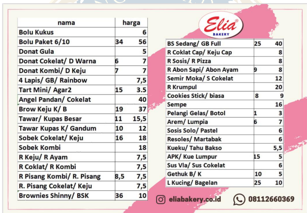
Gambar 1. 2 Menu Elia Bakery

Semakin banyaknya toko yang sudah terbuka, hal ini pertanda bahwa Elia Bakery sudah tidak terlalu memerlukan mobil kue untuk di beberapa titik sehingga secara perlahan mobil kue Elia Bakery ini mulai dikurangi hingga pada tahun 2020 hanya menggunakan satu mobil kue Elia Bakery. Namun, varian roti di Elia Bakery selalu bertambah hingga tahun 2021 sudah memiliki lebih dari 20 varian roti.